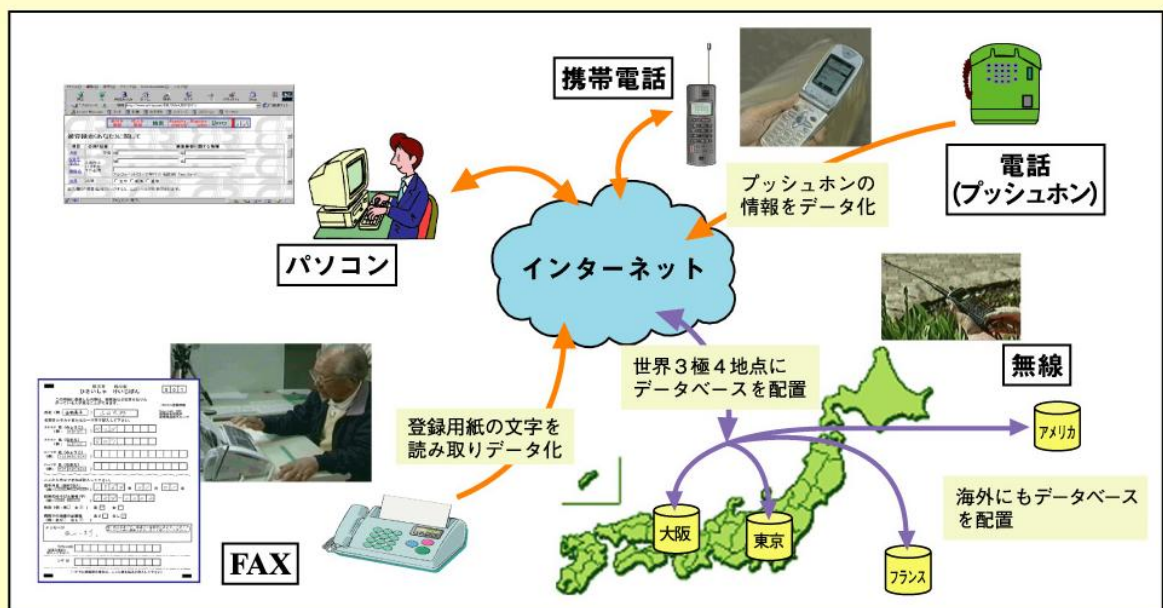
IAA (被災者情報登録検索) システム全体概要