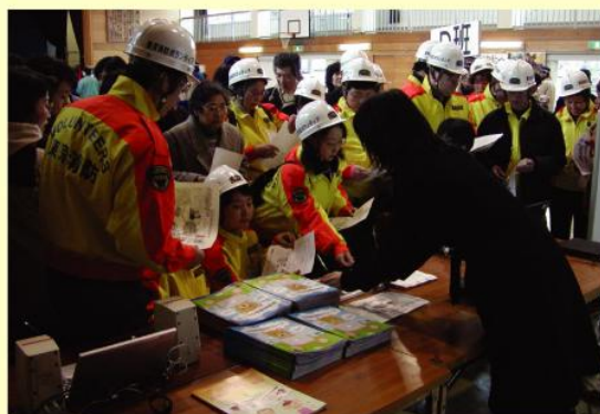
板橋区主催防災訓練