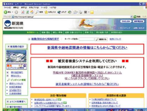
新潟県中越地震時の新潟県庁ホームページ