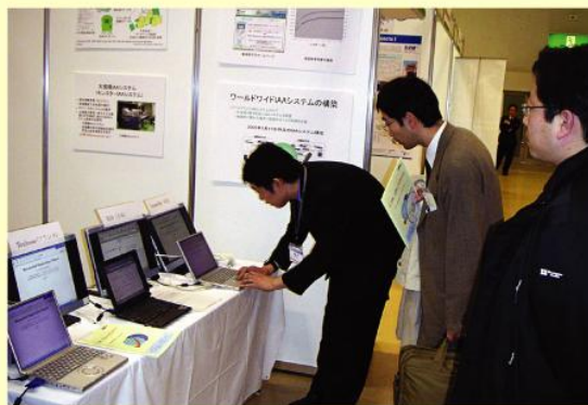
第9回震災対策技術展(神戸)